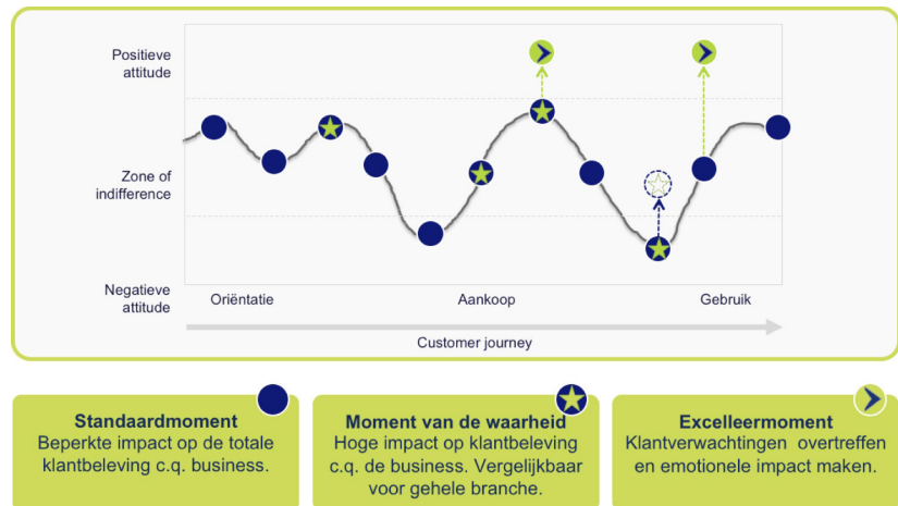
Figuur 1. Customer experience

Via masterclasses, trainingen, workshops en artikelen deelt het Instituut HR Bedrijfskunde kennis en inzichten met als doel een verdere ontwikkeling van HR-professionals en organisaties.